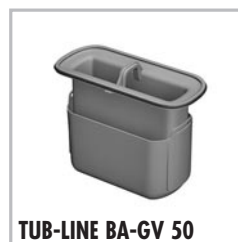
TUB-LINE BA-GV 50

is een stankafsluiter, sperwaterhoogte 50 mm, geschikt voor TUB-LINE BA-W 50.