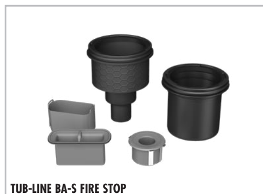
TUB-LINE BA-S FIRE STOP

Z-19.17-1719 verhindert met een brandwerendheid van 120 minuten resp. van 90 minuten (naargelang het plafond) de overdracht van vuur en rook volgens DIN 4102-2 mits inachtneming van de genoemde eisen in de toelating.