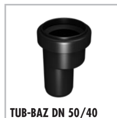
TUB-BAZ DN 50/40

is een verloopstuk met lippendichting van DN 50 naar DN 40.