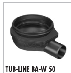
TUB-LINE BA-W 50

is een afvoer DN 50 horizontaal, zonder stankafsluiter, geschikt voor TUB-LINE BA-GV 50.